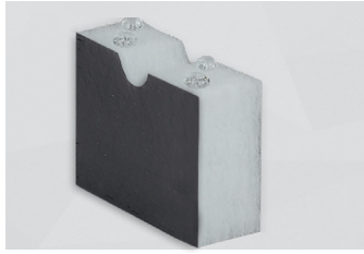
F700 FR HO HT